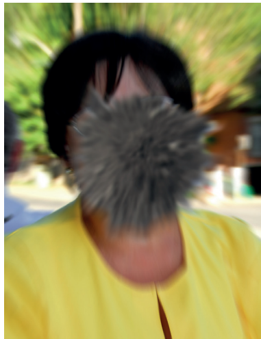
Zicht aangetast door natte LMD

Natte LMD is een lange termijn aandoening en u zult hoogstwaarschijnlijk blijvende medicatie zoals aflibercept nodig hebben om het te behandelen. Het is belangrijk om de behandeling vol te houden, want natte LMD kan zich snel uitbreiden. Het verlies van gezichtsvermogen die het veroorzaakt kan u ervan weerhouden om alledaagse dingen te doen. Denkt u aan autorijden, naar het park of winkelcentrum wandelen, het doen van het huishouden, lezen of gewoon televisie kijken.